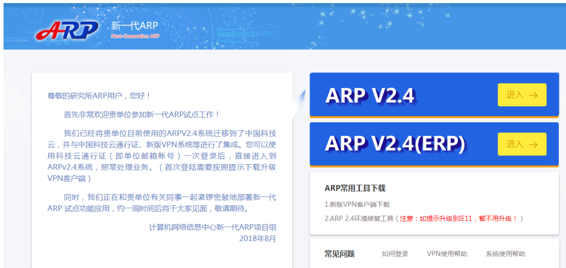
ARP v2.4 系统登录页