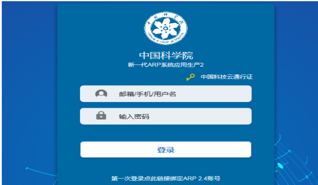
中国科技云账号登录页面