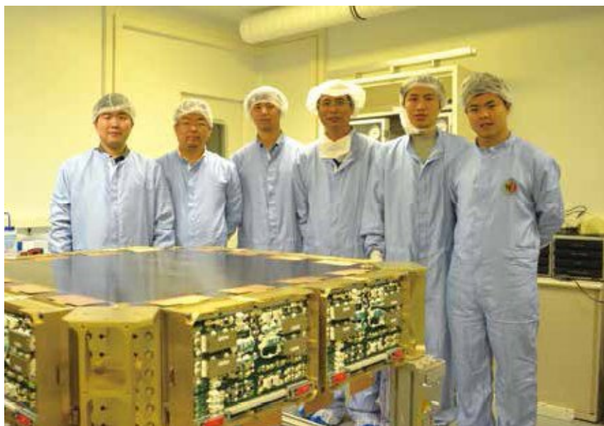
硅探测器正样件及研制团队。

宇宙中的万有引力定律明确证实了暗物质的存在，天文学家根据引力效应估计，暗物质和暗能量占了当今宇宙总能量密度的95%，甚至每一秒钟都有无数暗物质穿透人体，但它却从未被人直接观测到。可以说，它是隐藏最深、也是数量最庞大的“宇宙忍者”。